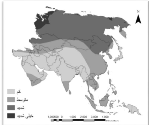
شکل ۳- نقشه‌ی خطر گرمایش در آسیا.