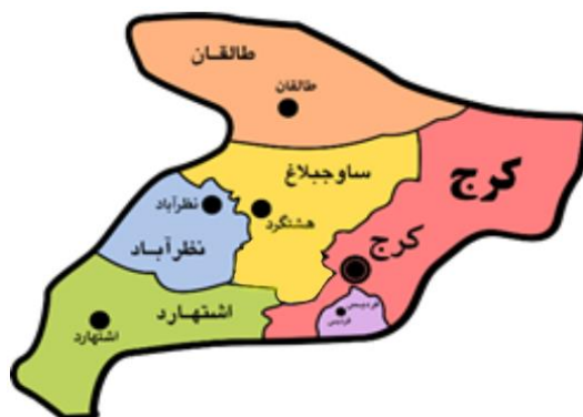
شکل ۱- منطقه مورد مطالعه: استان البرز

استان البرز در دامنه رشته کوه‌های البرز مرکزی که از شمال با استان مازندران، از غرب با استان قزوین، از شرق و جنوب شرقی با استان تهران و از جنوب غربی با استان مرکزی همسایه است و از نظر جغرافیایی در ۵۱ درجه درازای خاوری و ۳۵ درجه و ۴۹ دقیقه پهنای شمالی و در ۱۳۶۰ متر از سطح دریا قرار دارد. مجموع اراضی زراعی استان حدود ۴۵۰۰۰ هکتار است که به دلیل کمبود منابع آبی در حال حاضر و در سنوات اخیر سطح زیر کشت از ۳۸۲۰۰ هکتار به ۴۰۰۰۰ هکتار متغیر است. بیشترین سطح کشت مربوط به غلات پاییزه گندم و جو (۱۸۲۸۵ هکتار) است. شکل ۱ شهرستان‌های مورد مطالعه در استان البرز را نشان می‌دهد.