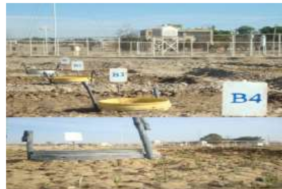
شکل ۳- مینی لایسیمترهای نصب شده در کرت های آزمایشی