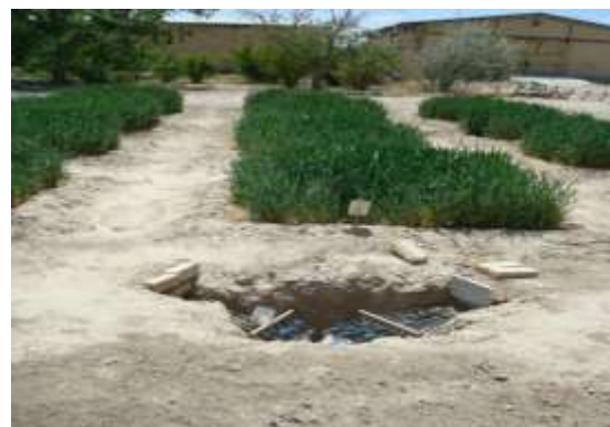
شکل ۴- نمای کلی از کرت های آزمایشی در مرحله ساقه رفتن گندم