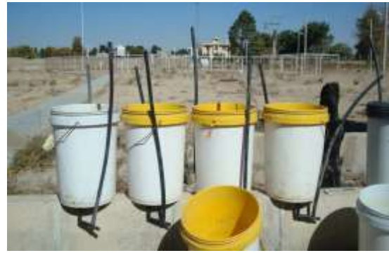
شکل ۲- مینی لایسیمترهای طراحی شده قبل از نصب در کرت های آزمایشی

در روش فوق خصوصیات گیاهی و خاک در نظر گرفته می شوند. همچنین روشی ساده و با صحت بالا می باشد ولی به علت تغییرات خاک و خطای نمونه برداری ۵ تا ۴۰ درصد خطا دارد. نیاز به نیروی کار زیاد و زمان بر بودن نیز از معایب این روش می باشد. استفاده از دستگاه نوترون متر می تواند جهت رفع