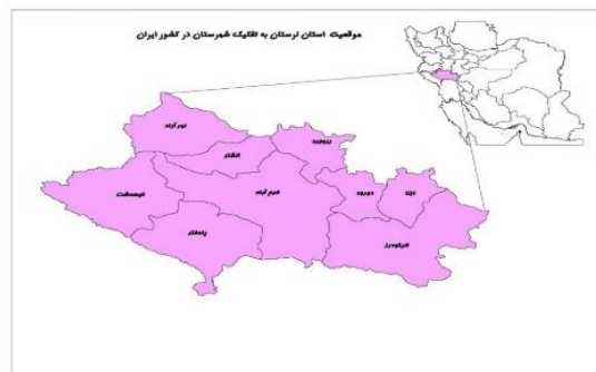
شکل ۱- موقعیت استان لرستان به تفکیک شهرستان در ایران

ایران، ۱/۷ درصد از کل مساحت کشور را در بر می‌گیرد. این استان بین مدارهای ۳۲ درجه و ۳۷ دقیقه تا ۳۴ درجه و ۲۲ دقیقه عرض شمالی و ۴۶ درجه و ۵۱ دقیقه تا ۵۰ درجه و ۳ دقیقه طول شرقی از نصف‌النهار گرینویچ قرار گرفته است. شکل شماره (۱) موقعیت استان لرستان به تفکیک شهرستان در ایران را نشان می‌دهد.