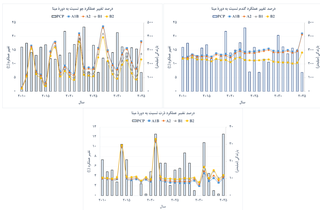
شکل 3- تغییرات عملکرد تحت سناریوهای افزایش غلظت دی‌اکسید کربن در برابر مقادیر بارندگی در فصل رشد (PCP)

(مانند گندم و جو) نسبت به گیاهان C4 (مثل ذرت دانه‌ای) نسبت به افزایش غلظت دی‌اکسید کربن در پژوهش‌های قبلی نیز گزارش شده است. (Allen, 1990) افزایش ۳۴ و ۱۵ درصدی را به ترتیب برای گیاهان C3 و C4 برای دو برابر شدن غلظت دی‌اکسید کربن گزارش نموده‌اند. Tubiello et al. , (2007) نیز افزایش ۳۰ تا ۵۰ درصدی را برای گیاهان C3 و افزایش ۱۰ تا ۲۵ درصدی را برای گیاهان C4 برای افزایش غلظت دی‌اکسید کربن مشابه را گزارش کرده‌اند. درصد افزایش عملکرد پیش‌بینی شده در این تحقیق به این دلیل کمتر از مقادیر گزارش شده توسط Tubiello et al. , (2007) و Allen, (1990) است که تا سال ۲۰۳۵، افزایش غلظت دی‌اکسید کربن در سناریوهای مختلف حداکثر ۲۲ درصد در نظر گرفته شده که در قیاس با افزایش غلظت دی‌اکسید کربن در این دو مطالعه کم‌تر است.