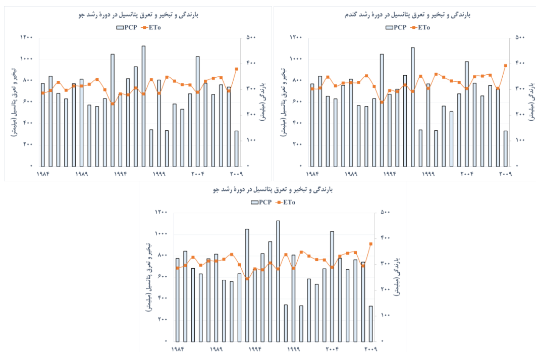
شکل ۲- مقادیر بارندگی (PCP) و تبخیر و تعرق پتانسیل (ETo) در طول دوره رشد برای دوره مینا (۱۹۸۴-۲۰۰۹)