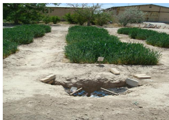
شکل ۴- نمای کلی از کرت های آزمایشی در مرحله ساقه رفتن گندم