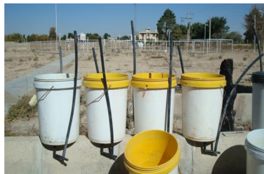
شکل ۲- مینی لایسیمترهای طراحی شده قبل از نصب در کرت های آزمایشی

در روش فوق خصوصیات گیاهی و خاک در نظر گرفته می شوند. همچنین روشی ساده و با صحت بالا می باشد ولی به علت تغییرات خاک و خطای نمونه برداری ۵ تا ۴۰ درصد خطا دارد.