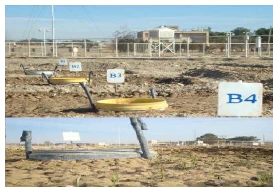
شکل ۳- مینی لایسیمترهای نصب شده در کرت های آزمایشی