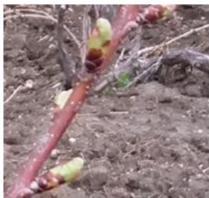
شکل ۳- ظهور برگ سبز در نوک جوانه