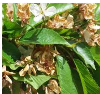
شکل ۱۰- پایان گلدهی