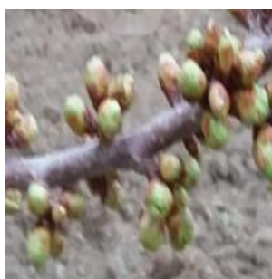
شکل ۷- شکفتن جوانه