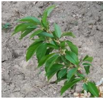
شکل ۵- توسعه شاخه