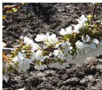
شکل ۹- اوج گلدهی