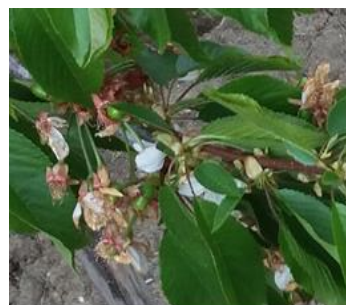
شکل ۱۱- مرحله نمو میوه