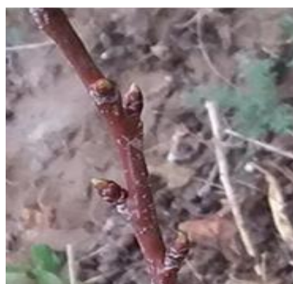
شکل ۲- مرحله تورم جوانه