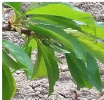
شکل ۴- توسعه اولین برگ

درصد سبزی نهایی خود می‌رسد پایان می‌یابد. در منطقه مطالعاتی این مرحله حدوداً از ۱۴ اردیبهشت آغاز و در ۱۶ خرداد پایان یافت. طول دوره‌ی نمو میوه ۳۴ روز ثبت گردید. بنابراین می‌توان مرحله نمو میوه را در مقایسه با دیگر مراحل رشد، طولانی‌ترین دوره در نظر گرفت. نسبت به دوره گلدهی میانگین درجه حرارت هوا با ۵ درجه افزایش به ۱۷/۵ درجه سلسیوس رسید و میانگین حداکثر و حداقل آن به ترتیب ۲۷/۳ و ۷/۷ درجه سلسیوس ثبت گردید (شکل ۱۱).