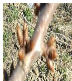
شکل ۶- متورم شدن جوانه گل آذین