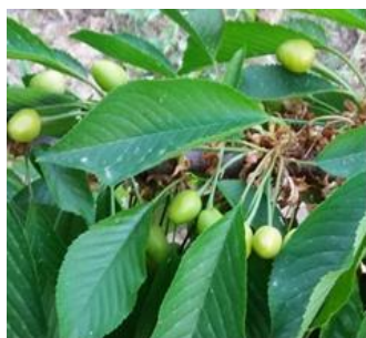
شکل ۱۲- سایز نهایی میوه