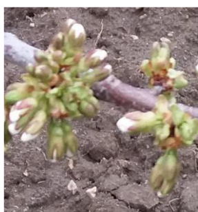
شکل ۸- مرحله پایانی ظهور گل آذین

برای محاسبه میزان واحد حرارتی مورد نیاز هر کدام از مراحل رشد گیلاس، از هر دو روش درجه حرارت مؤثر و فعال بهره گرفته شد. نتایج در جدول (۲) آورده شده است. بر این اساس درخت گیلاس، در مجموع برای تکمیل فعالیت بیولوژیکی خود تا پایان دوره رسیدگی میوه در منطقه مورد مطالعه به ۲۰۴۰ درجه روز برحسب دمای مؤثر و ۲۷۷۵ واحد حرارتی بر